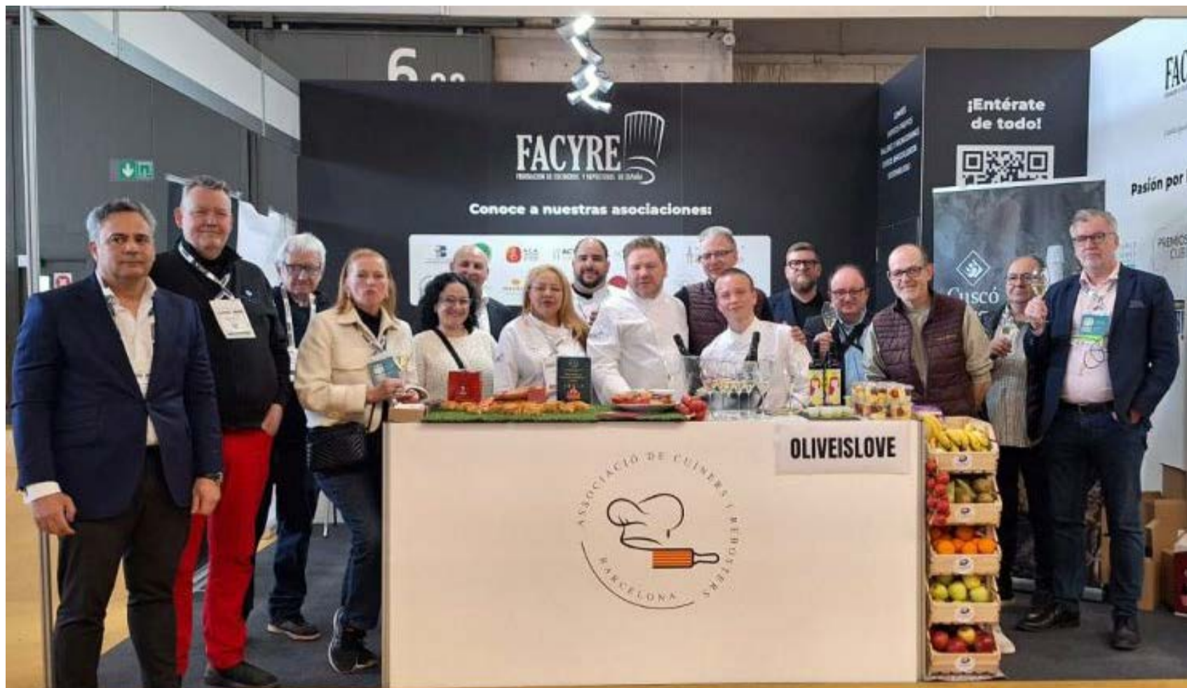
L'Equip firal de ACYRE Barcelona juntament amb l'equip de FACYRE España i Partners patrocinadors.

Destaquem la confiança de FACYRE España, per permetre'ns compartir l'estand i, sobretot, pel seu suport constant i incondicional durant tot l'esdeveniment . Aquesta suport ha estat clau perquè ACYRE Barcelona pogués mostrar la seva capacitat d'organització, convocatòria i representació institucional.